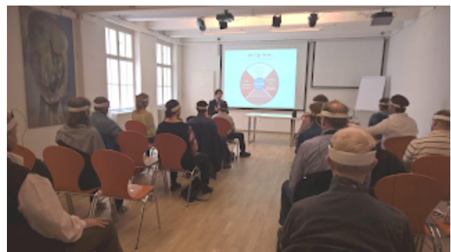
Theta-X Techno-Meditation im PEP-Center Wien

Dieser Fluss von Elektronen kann auch ( davon geht man heute aus ) die