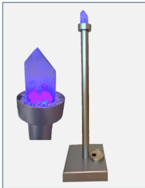
Primärer Kristall Harmonizer im PEP-Center

Der Bergkristall ist eine Verbindung zwischen der von uns wahrgenommenen 3-dimensionalen Welt und dem höheren Bewusstsein. In jedem Whisper steckt ein Kristall Harmonizer, welcher das Gehirn vom ersten Theta-X Seminar an auf die Kräfte der, durch den Kristall harmonisierte, Energien vorbereitet und einstellt.