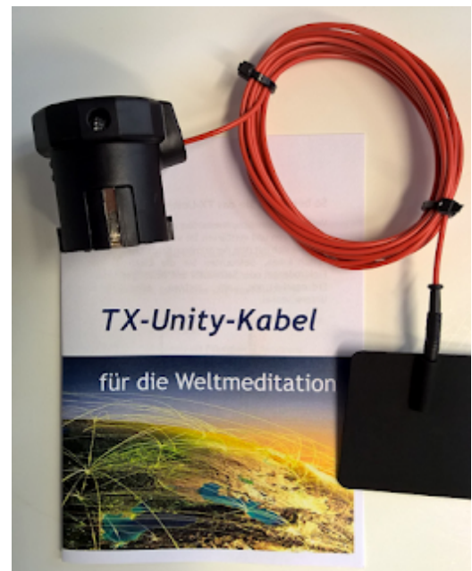
TX-Unity-Kabel (Erdungskabelset) für die Theta-X Welt-Meditation, ab TX 7

Meditationszeit, Internetzeit, Swatch-beat: Info